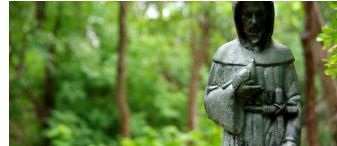
1979 m. lapkričio 29 d., šventasis popiežius Jonas Paulius II paskelbė šv. Pranciškų Asyžietį „visų, besirūpinančių ekologija, dangiškuoju globėju“.

Lietuvos pasauliečių pranciškonų ordino UGDYMO MĖNRAŠTIS Nr. 63 (2019 m. vasaris)