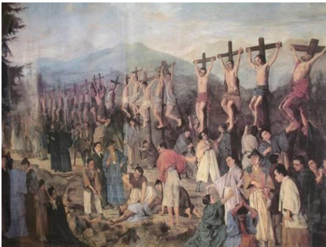
Japonijos kankinių nukryžiavimas

matmenį. Šis matmuo turi būti atpažintas ir gerbiamas visuose visuomenės sluoksniuose kaip vienintelis kelias į tikrą taiką ir suderintą žmonijos vystymąsi.